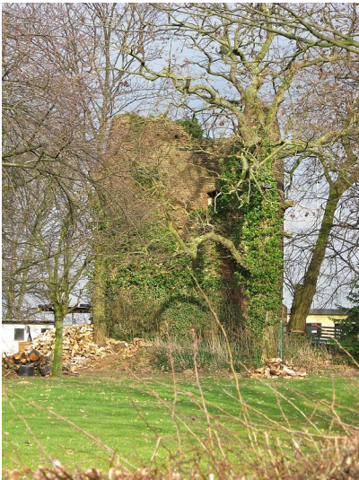
Blick auf den Mühlenstumpf der Settericher Windmühle von Westen (2011).