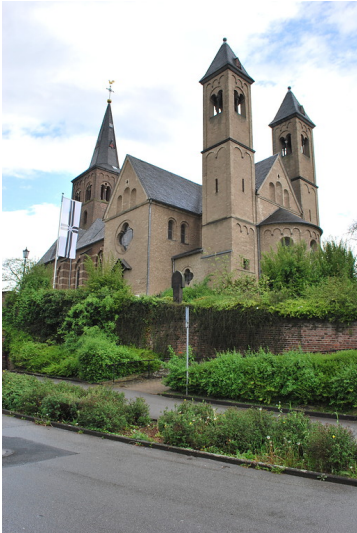
katholische Pfarrkirche St. Remigius, Bergheim (2015)