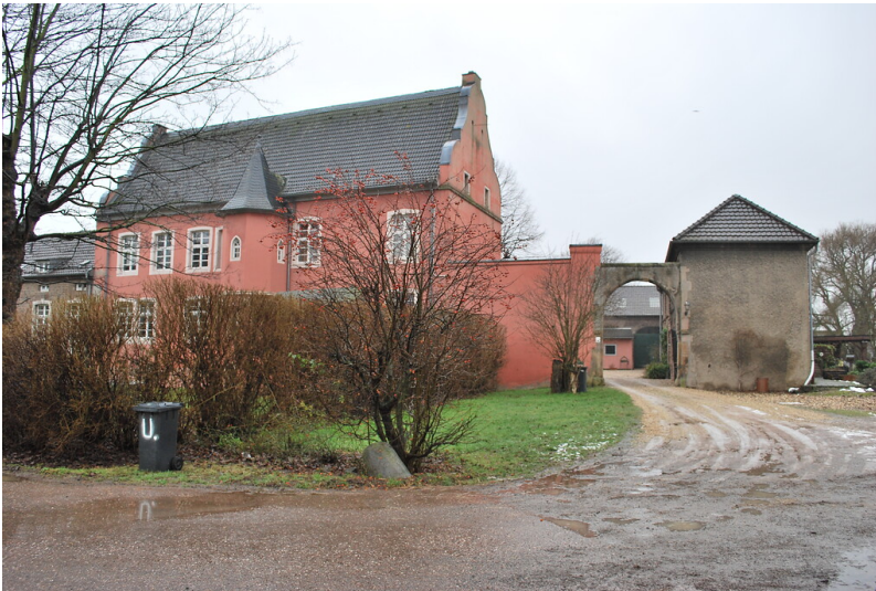
Toreinfahrt von Haus Breitmaar mit Herrenhaus und Wirtschaftsgebäude (2015).