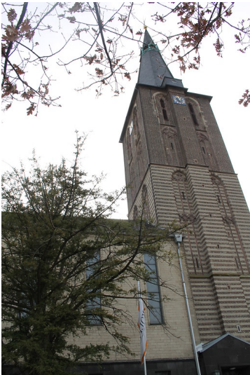
Katholische Pfarrkirche Sankt Martinus in Kerpen (2017)