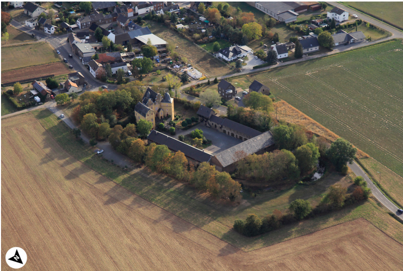
Luftbildaufnahme von der Burg Bodenheim mit Nordpfeil (2018)