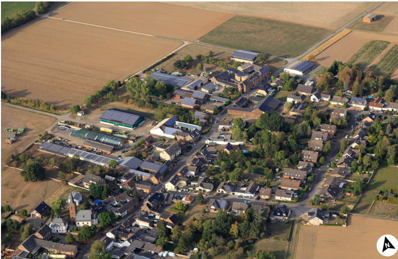
Luftbildaufnahme von Elsig mit Nordpfeil (2018)