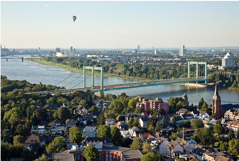
Luftbild mit der Rodenkirchener Rheinbrücke im Süden von Köln (2010). Im Vordergrund ist der Kölner Stadtteil Rodenkirchen und im Hintergrund der Stadtteil Deutz zu sehen.