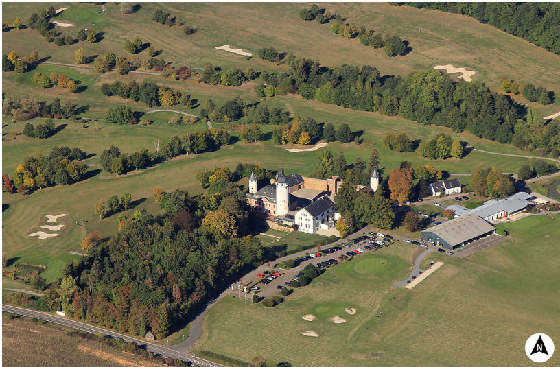
Luftbildaufnahme der Burg Zievel mit Nordpfeil (2018)