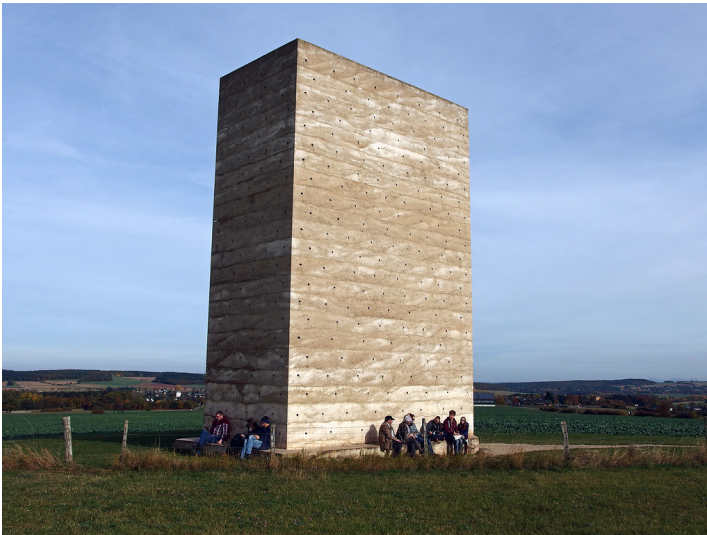
Bruder-Klaus-Kapelle in Wachendorf (2016)