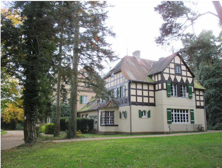
Gut Giersberg (2014)