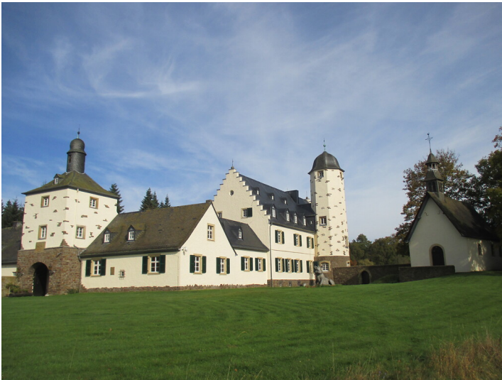
Gut Hospelt mit Kapelle St. Josef (2014)