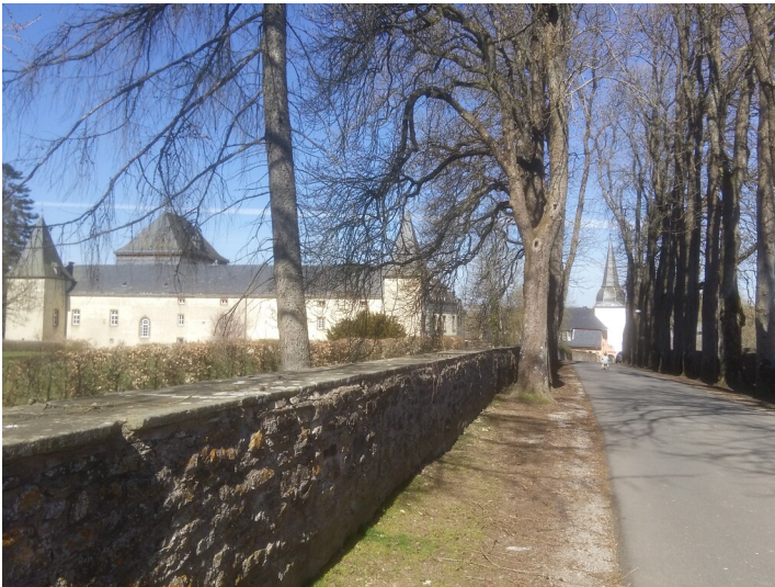
Allee zum Schloss Schmidtheim (2014)