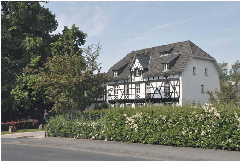
Haus Steinbüchel in Leverkusen (2015)