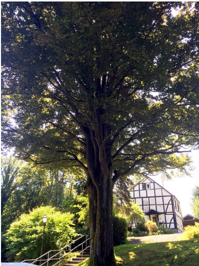
Naturdenkmal Rotbuche und Blutbuche in Kürten-Delling (2016)