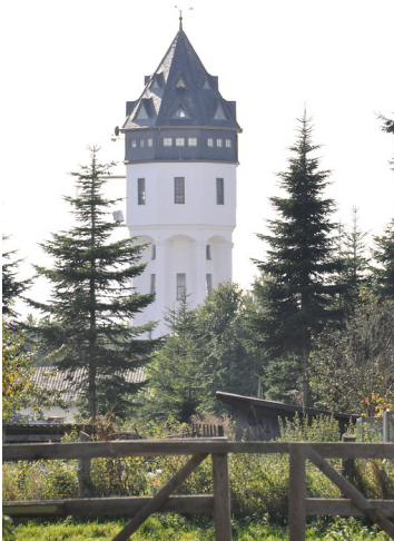
Wasserturm in Rösberg (2014)