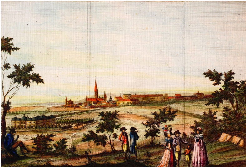
Radierung von Charles Dupuis: Blick vom Kreuzberg auf die Stadt Bonn mit der wiederaufgebauten kurfürstlichen Residenz nach dem Brand des Jahres 1777. Deutlich zu erkennen sind die fehlenden Nordtürme des Schlosses und die Poppelsdorfer Allee als Verbindung des Buen-Retiro mit dem Schloss Clemensruhe in Poppelsdorf. Fotograf/Urheber: Dupuis, Charles