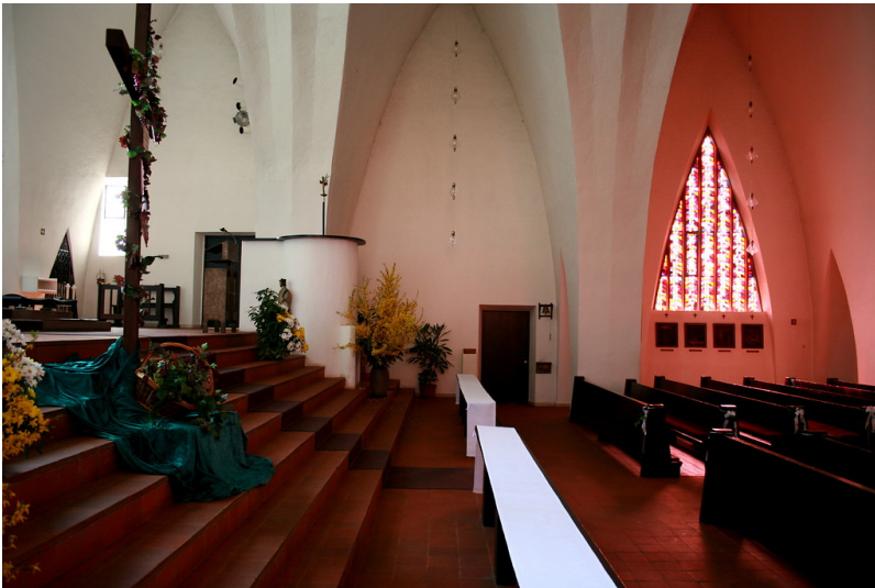
Innenansicht des Altarbereichs von St. Apollinaris in Lindlar-Frielingsdorf (2009)