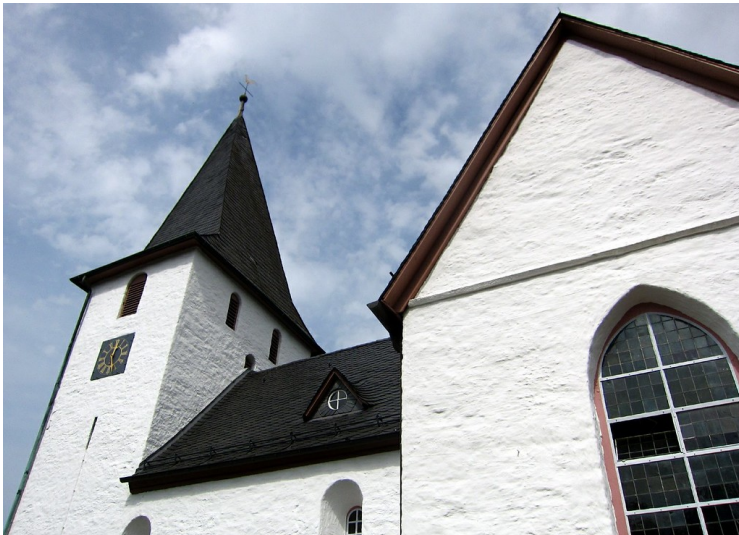
Die evangelische Pfarrkirche "Bunte Kerke" in Lieberhausen (2011).