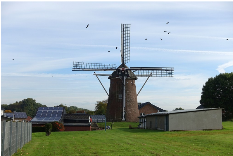
Lümbacher Windmühle (2017)