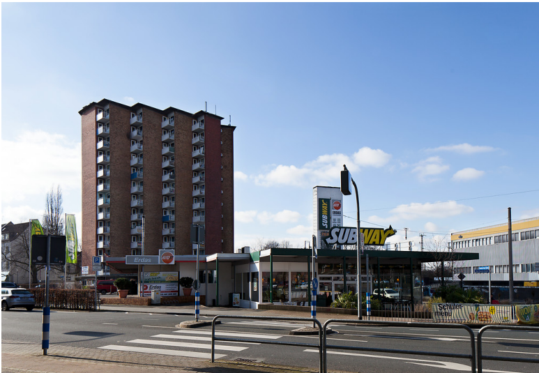
Oberhausen-Altstadt-Mitte, Stöckmannstr. 26 - 28 / Friedr.-Karl-Str. 4 - 8, Wohn- und Geschäftshaus