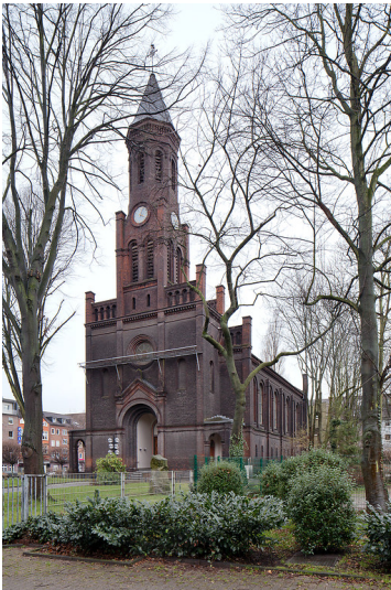
Oberhausen-Altstadt-Mitte, Ev. Christuskirche, Nohlstr. 7