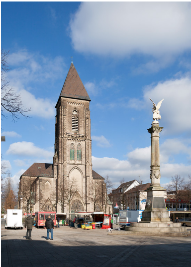
Oberhausen-Altstadt-Süd, Kath. Pfarrkirche Herz-Jesu, Altmarkt