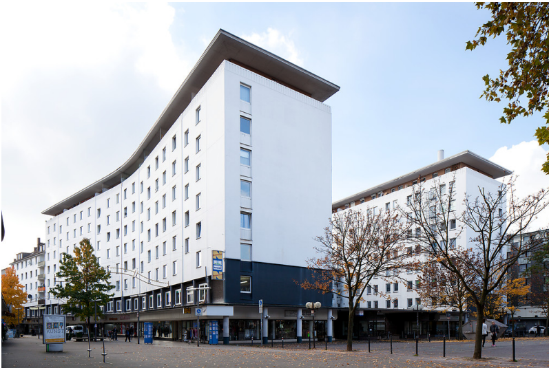
Oberhausen-Altstadt-Mitte, Europahaus, Elsässer Str. 17 - 25, Friedensplatz 8, Langemarkstr. 10 - 16