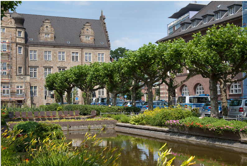
Oberhausen-Altstadt, Friedensplatz