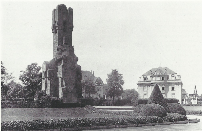
Der Bismarckturm und die Villen Bayenthalgürtel 4 (rechts) und 6 (links) in Köln-Marienburg um 1909.