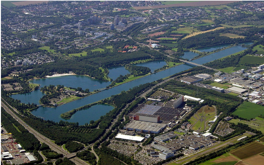
Luftaufnahme des Naherholungsgebiets "Fühlinger See" im Norden von Köln aus östlicher Blickrichtung (2012).