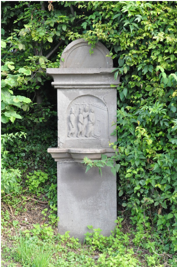
III. Station „Gefangenennahme“, Fußfall (1867) am Kreuzweg an der Höhenstraße Lindlar-Kalkofen (2014)