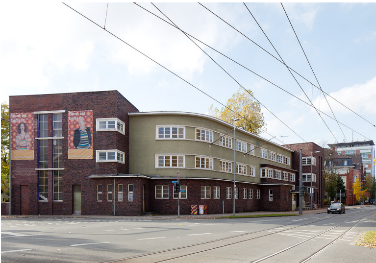
Oberhausen-Altstadt-Mitte, Danziger Str. 11 - 13, ehem. Arbeitsamt