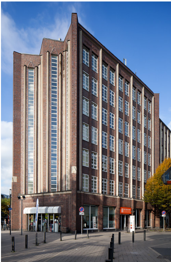
Oberhausen-Altstadt-Mitte, Langemarkstr. 21, "Bert-Brecht-Haus"