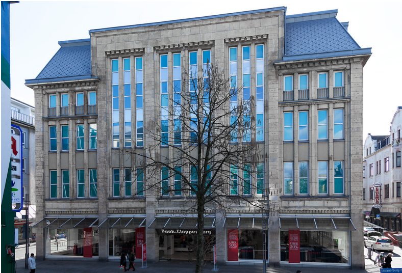
Oberhausen-Altstadt-Süd, Marktstr. 43, ehemaliges Kaufhaus Magis, Peek & Cloppenburg