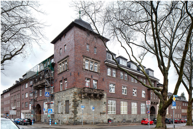
Oberhausen-Altstadt-Mitte, Grillostr. 14 / Schwartzstr. 62, Sparkassengebäude