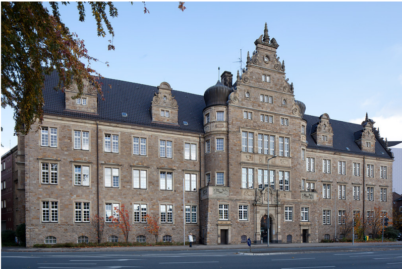
Oberhausen-Altstadt-Mitte, Amtsgericht, Friedensplatz 1