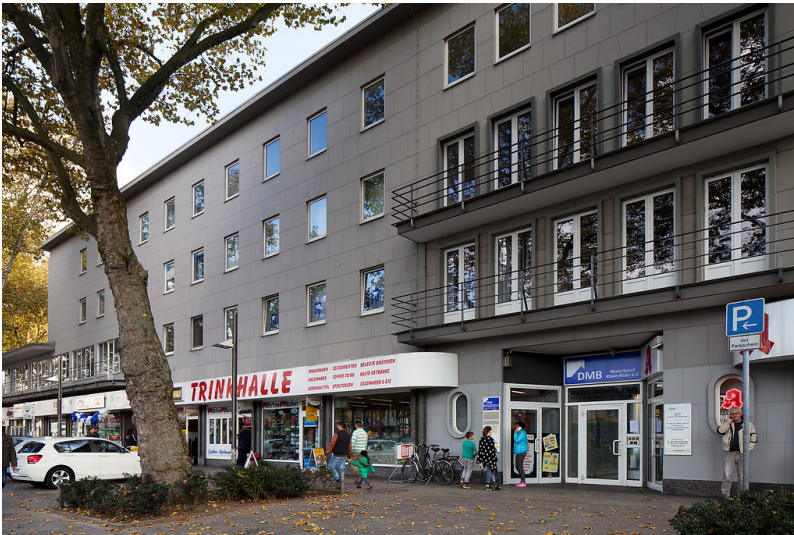
Oberhausen-Altstadt-Mitte, Willy-Brandt-Platz 2, Haus Ruhrland