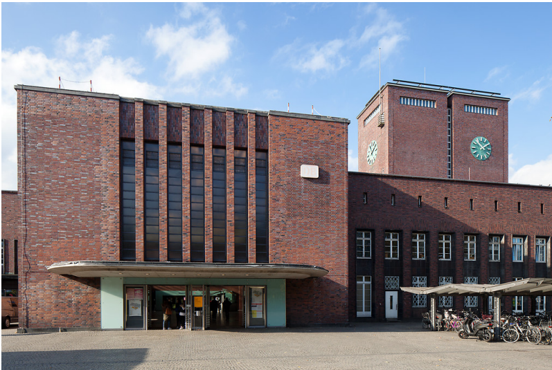
Oberhausen-Altstadt-Mitte, Hauptbahnhof, Willy-Brandt-Platz 1