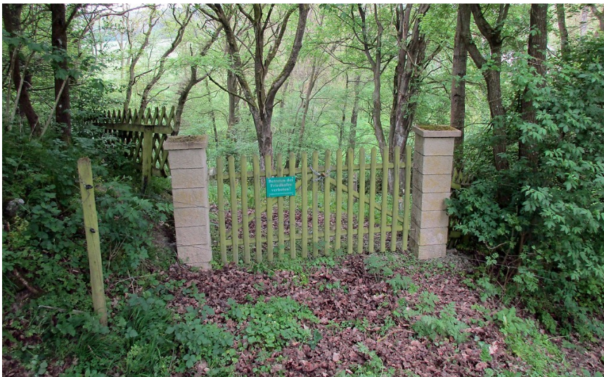
Eingangsportal zum Judenfriedhof Unterm Bingelsberg in Dörrebach (2016).