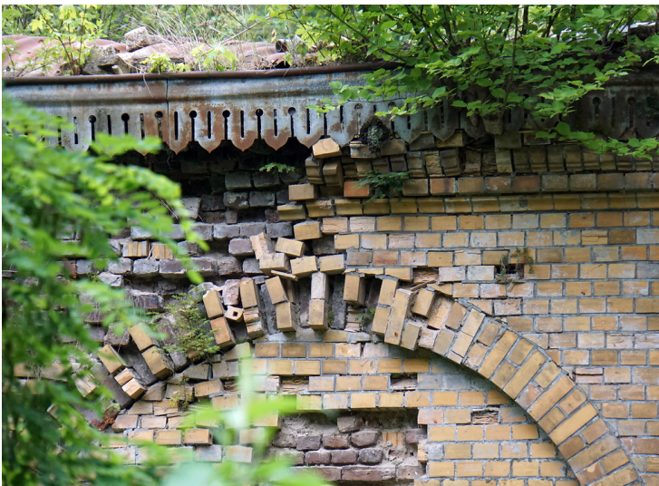
Im Verfall befindlicher Rundbogen aus Backstein in der vorderen Hausfassade der ehemaligen Villa Oppenheim (2018).