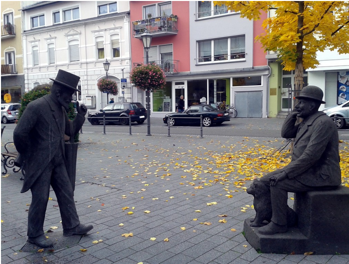
Basaltfiguren "Hendrech on Jösef" in Bad Neuenahr (2015).