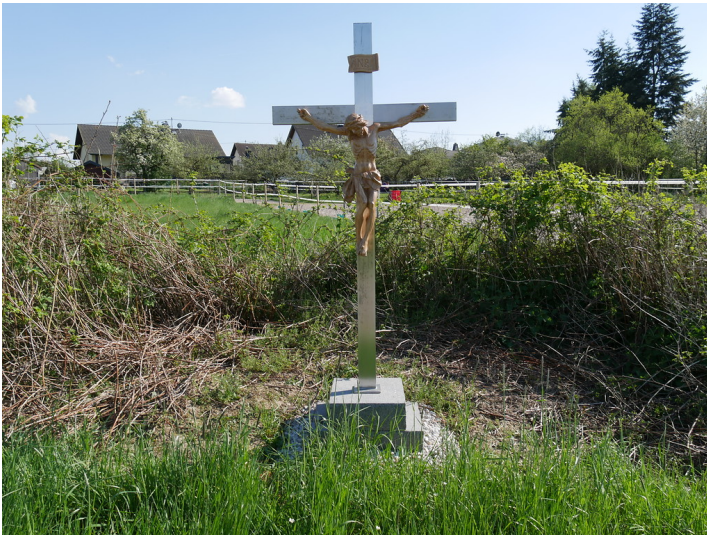
Wegekreuz an der Landstraße L 242 nordwestlich der Ortslage von Dörrebach im Kreis Bad Kreuznach (2016)