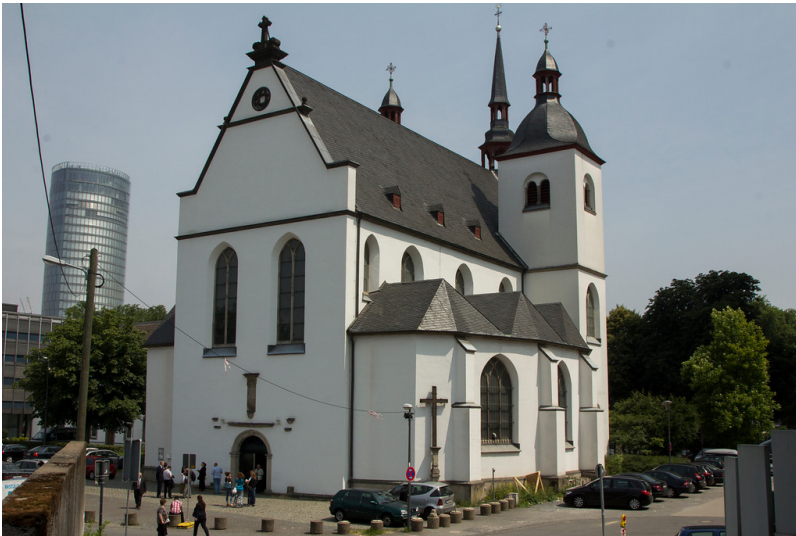
Die Abteikirche der früheren Benediktinerabtei St. Heribertus in Köln-Deutz (2013).