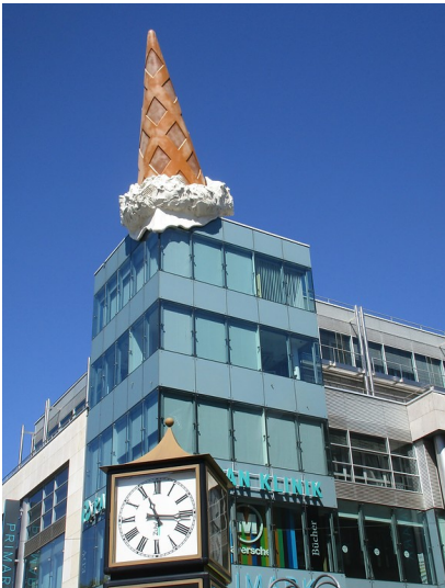
Pop-Art-Skulptur "Köln Eistüte" auf einem Geschäftsgebäude Ecke Zeppelinstraße / Neumarkt in Köln-Altstadt-Süd (2019). Das markante Kunstwerk "Dropped Cone" (umgangssprachlich "Kölner Eistüte") stammt von dem Künstler Claes Oldenburg (1929-2022).