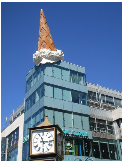
Pop-Art-Skulptur "Kölner Eistüte" auf einem Geschäftsgebäude Ecke Zeppelinstraße / Neumarkt in Köln-Altstadt-Süd (2019). Das markante Kunstwerk "Dropped Cone" (umgangssprachlich "Kölner Eistüte") stammt von dem Künstler Claes Oldenburg (1929-2022).