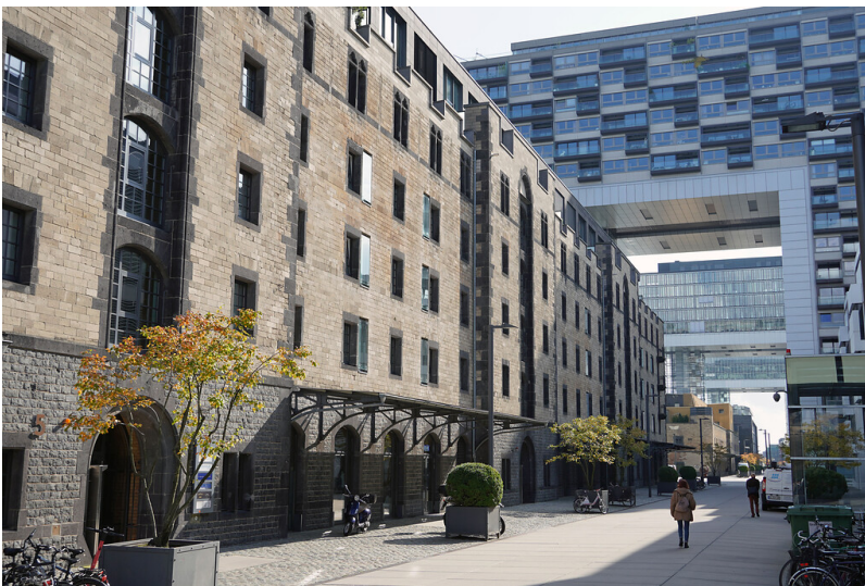
Blick von der Straße "Am Zollhafen" in Richtung der drei Kranhäuser im Rheinauhafen in Köln-Altstadt-Süd (2021). Alte und neue Architektur ergänzen sich hier meisterlich.