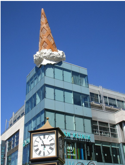
Pop-Art-Skulptur "Kölner Eistüte" auf einem Geschäftsgebäude Ecke Zeppelinstraße / Neumarkt in Köln-Altstadt-Süd (2019). Das markante Kunstwerk "Dropped Cone" (umgangssprachlich "Kölner Eistüte") stammt von dem Künstler Claes Oldenburg (1929-2022).