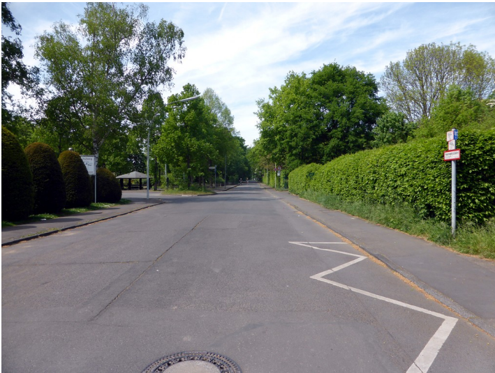
Martin-Luther-King-Straße in Bonn, Blick nach Norden (2016).