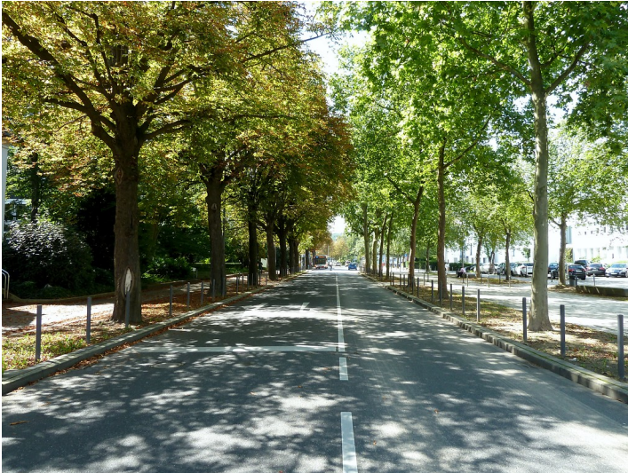
Winston-Churchill-Straße im Bonner Regierungsviertel (2017), Blick in Richtung Nordwesten.