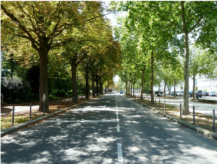
Winston-Churchill-Straße im Bonner Regierungsviertel (2017), Blick in Richtung Nordwesten.