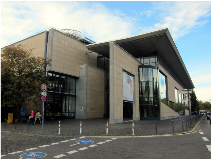
Das Haus der Geschichte der Bundesrepublik Deutschland in Bonn (2014)