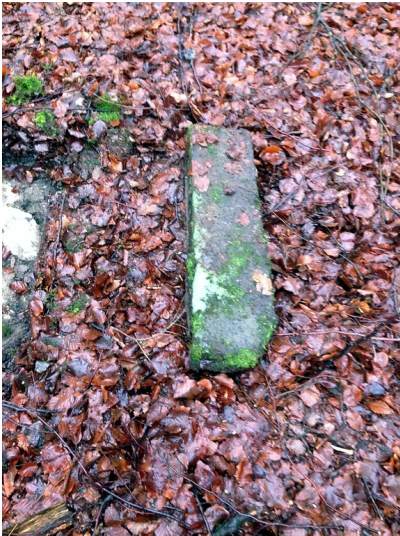
Abteilungsstein im Wald bei Thranenweier (2015)