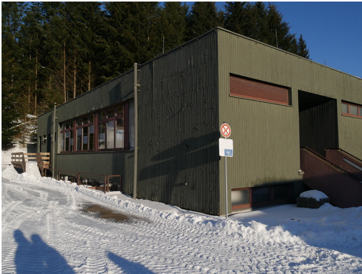
Ehemalige Mensa des Bunkers Erwin bei Börfink (2017)