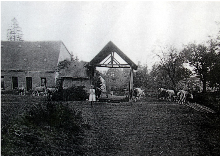
Historisches Foto des Wiegehäuschens der Eisenhütte Abentheuer (undatiert).